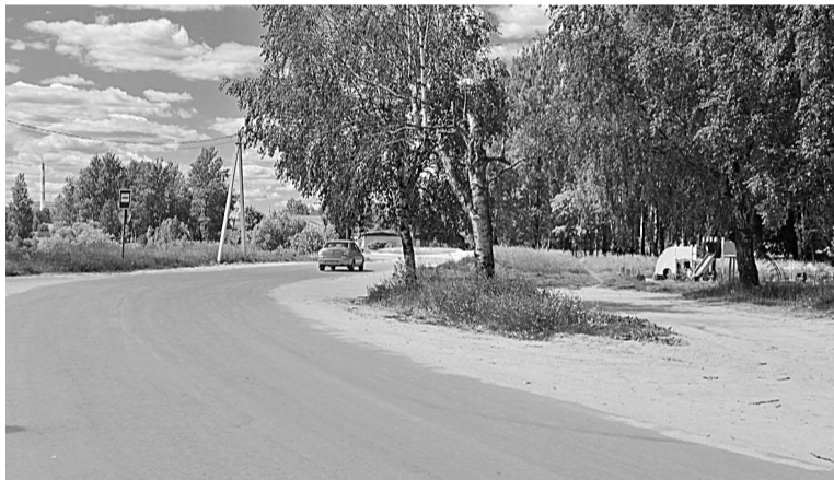
По свежему асфальту на улице А. Суворова...

Проект «Дорога к дому» также реализуется и в районе, на эти цели дорожным фондом пре-