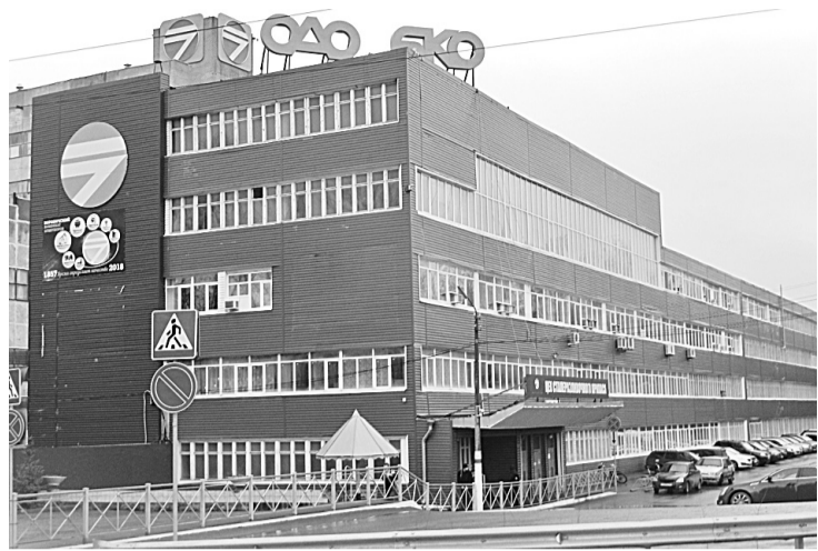
Цех сталеразливочного припаса